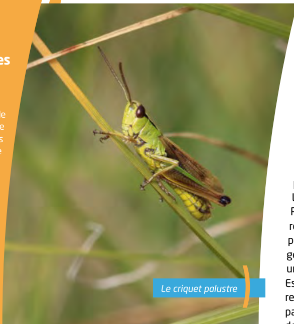
Le criquet palustre

On y observe également 138 espèces végétales , dont 9 ont un intérêt patrimonial. C'est le cas en particulier de la Potentille des marais, plante remarquable des tourbières. La Campanille à feuilles de lierre et la Dorine à feuilles opposées sont présentes dans la partie boisée.