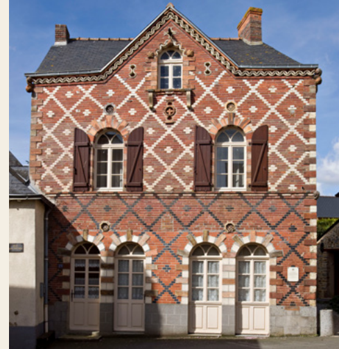
Maison Fripiet à Parmé-sur-Roc, petite cité de caractère (53)