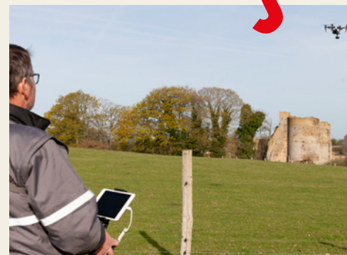
Prises de vues aériennes réalisées par un photographe pilotant un drone

L'Inventaire des Pays de la Loire a couvert environ 30% du territoire régional sous la forme d'opérations topographiques, et a mené de nombreuses opérations thématiques : peintures murales, parcs et jardins, patrimoine maritime et fluvial (villégiature balnéaire, phares, bateaux), patrimoine ferroviaire et industriel (métallurgie, verrerie, ardoisières, construction navale, moulins, mines et carrières, mines d'uranium).