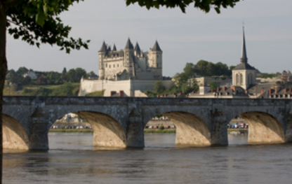
Saumur (49) et le pont Cessart