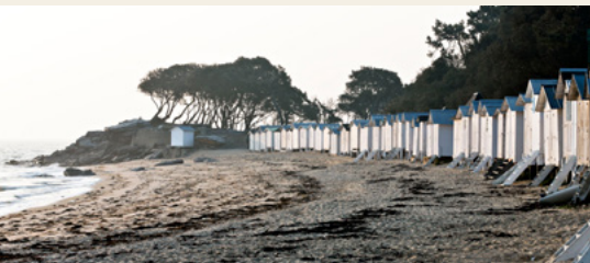
Bois de la Chaise, cabines sur la plage des dames, Noirmoutier (85)

Le regard embrasse l'exceptionnel comme le quotidien, les œuvres originales comme les copies, les créations uniques comme les productions en série. En outre, depuis quelques années, une attention se fait jour à l'échelle nationale pour intégrer au mieux les notions de paysage et de patrimoine culturel immatériel dans les études d'inventaire.